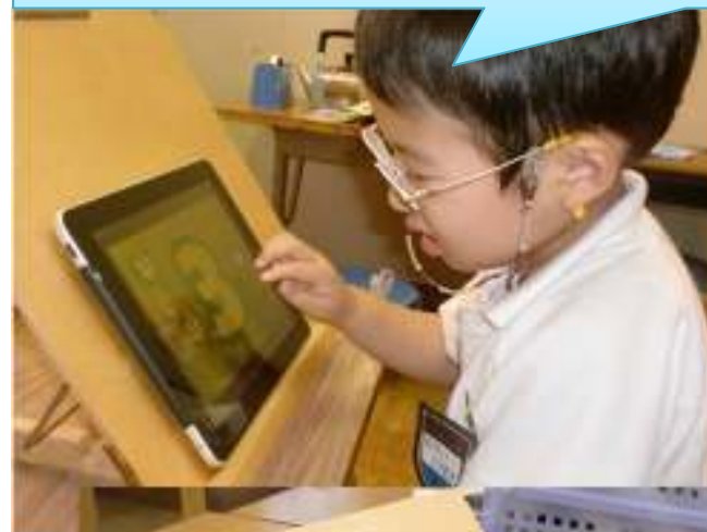
書見台を利用している幼児の様子

数・色・形などの形成概念の理解に役立っている。弱視の児童生徒にとっては、色が見やすく、また、正解した時の効果音も魅力的で、紙面での学習よりも、集中して学習することができた。弱視の幼児・児童にとっては、書見台を使用している利用が姿勢など考慮した点でも効果的であった。