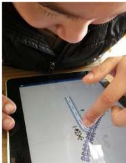
手と目の協応操作練習の様子