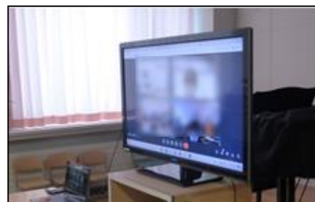
図7 合同授業(音楽)の様子②