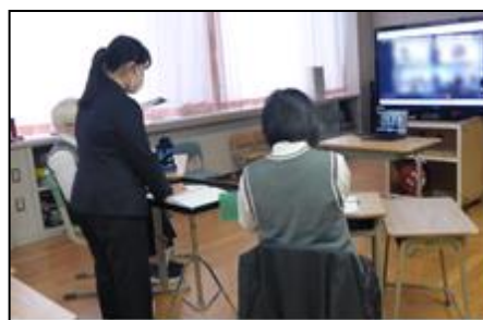
図6 合同授業(音楽)の様子①

・個々で意見をまとめる際には、時間を確保し、そのことを生徒に明確に伝えたことによって、画面が見えない、見えにくい生徒の音声のない時間があることによる不安を解消することができた。