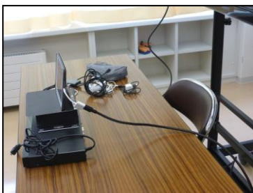
図3 札幌視覚支援学校の接続環境