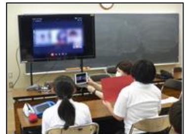
図2 児童生徒会活動の様子