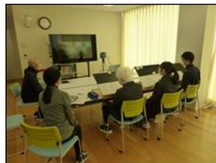
図8 合同授業(国語)の様子①