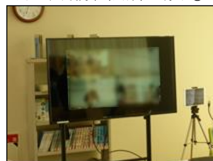
図9 合同授業(国語)の様子②