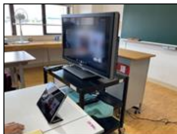
図4 函館盲学校の接続環境①