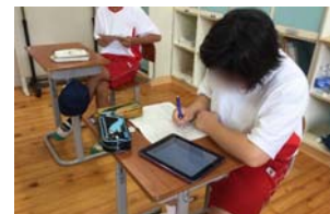
iPad で撮影した宿泊学習の内容をしおりに書き写す様子