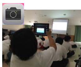
見通しなどを撮影

使い始めて1ヶ月頃の連絡帳より。保護者から「宿泊学習の予定を見せてくれました。自分でもiPadで何度も確認していました。」とのこと。