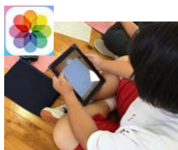
空いた時間に何度も見て確認