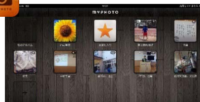
“MyPhotoHD”で作った自分マニュアル

iPad を持って行くタイミングを教えると2週間程度で生単の事前学習や音楽の授業に自分の判断で持って行くようになる。事前学習で行事のスケジュールやメンバーを写真に撮り、何度も見返していた。宿泊学習ではiPadを見る余裕もないほど慌ただしいスケジュールだったが、落ち着いて行動することができた。授業や部活動では教師の見本を撮影し何度も見返している。データ量が多くなると“MyPhotoHD”というアプリを使いフォルダ分けして自分マニュアルの作成(情報の整理)を行った。