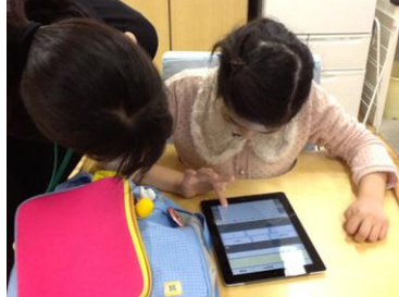
↑ 教員や介護等体験の学生と iPad を使って会話している様子