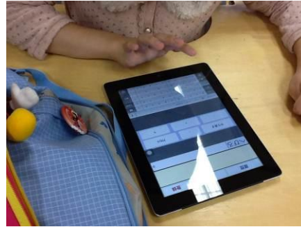
↑ 「流畅タイプ」の入力中の画面