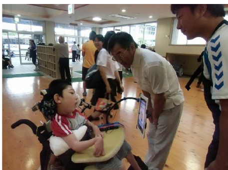
・高等部の先生と朝のあいさつ