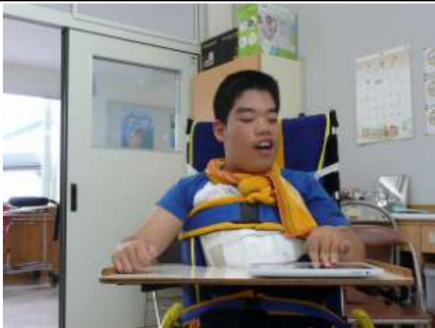
高2男子(重複障害:肢体不自由) アプリ「猫たたき」2