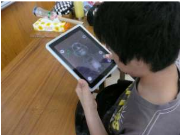
高2男子(重複障害:肢体不自由) アプリ「Talking Tom」1