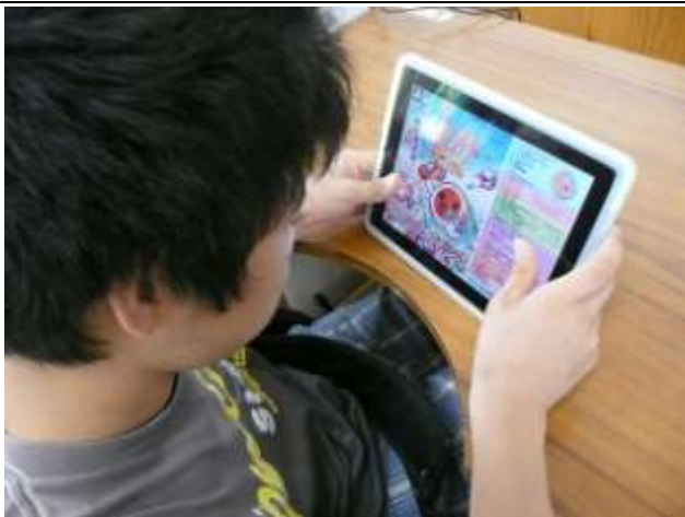
高2男子(重複障害:肢体不自由) アプリ「太鼓の達人」