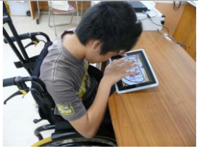
高2男子(重複障害:肢体不自由) アプリ「やってみよう」2