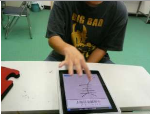
高1男子(単一障害:病弱) アプリ「書き取り漢字練習」1