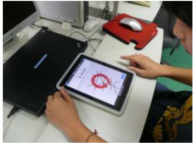
高1男子(単一障害:病弱) アプリ「書き取り漢字練習」4