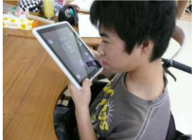
高2男子(重複障害:肢体不自由) アプリ「Talking Tom」2