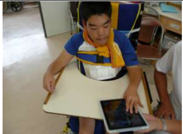
高2男子(重複障害:肢体不自由) アプリ「猫たたき」3