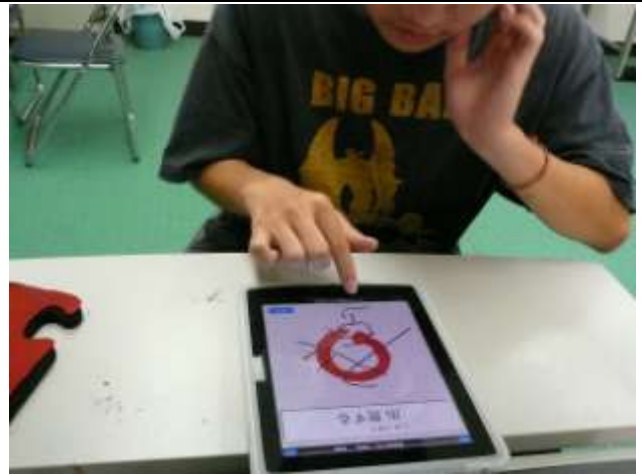
高1男子(単一障害:病弱) アプリ「書き取り漢字練習」2