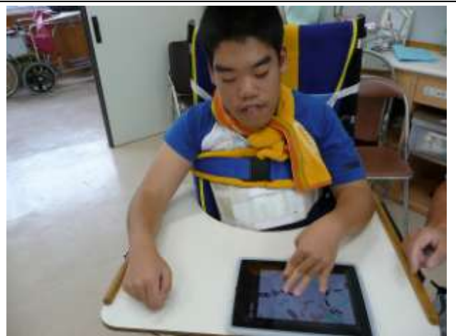
高2男子(重複障害:肢体不自由) アプリ「猫たたき」