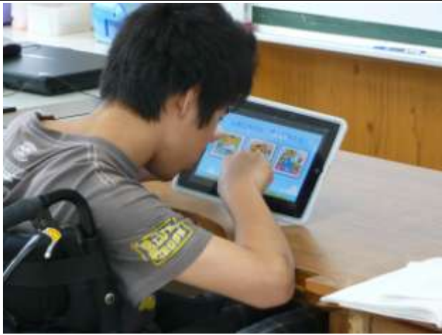
高2男子(重複障害:肢体不自由) アプリ「やってみよう」1