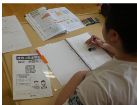
ノートを一元化できるインデックス付ルーズリーフ