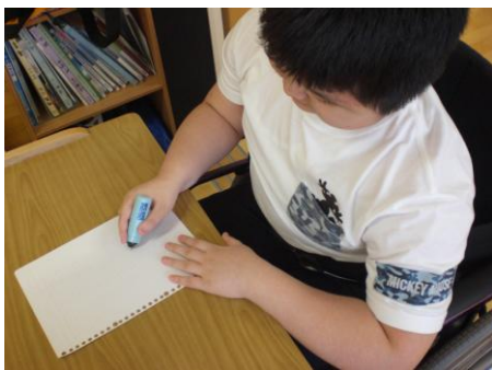
自力書字の際の電動消しゴム使用場面