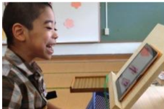
写真3 FaceTime で会話と楽しむ A 児

特に、A 児が楽しみにしているのが祖父母との Facetime でのやりとりである。毎回、祖父母と「今日は〇〇したよ！金曜日迎えにくる?じいじいお仕事頑張ってる?」など、楽しく会話する様子が見られた（写真3）。