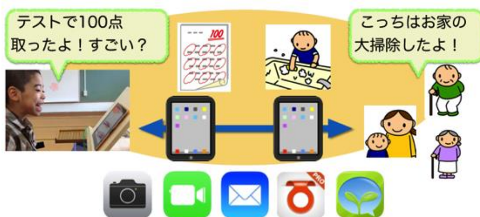
図1 実践のイメージ図

合ったり、会話したりできるようにした（図1）。活動当初は、「お楽しみタイム」と称して4校時に週3～5回のペースで母親や祖父母とやりとりをし、返信メールについては5校時に確認していた。10月からは、授業や休み時間等の状況を考慮しながら、A児が「やりとりしたいとき」を基本にいつでもやりとりできるようにした。