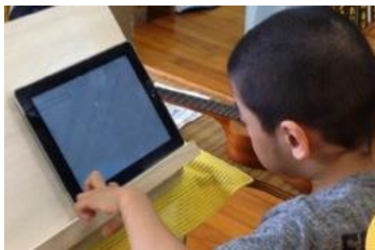
写真2 メールをする A 児

当初、A 児はメールでやりとりすることがどういうことか理解できていなかったが、家族と FaceTime やメールをする中で「離れていてもやりとりできるんだね！楽しい！」という発言が聞かれるようになった（写真2）。4 校時にメールができるとわかっている A 児は、1～3 校時の学習中に「写真撮ってください！おばあちゃんに送りたい！」などメールを楽しみにしているようであった。