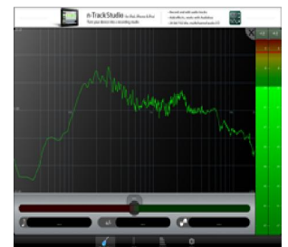
図4 「n-Track Tuner」