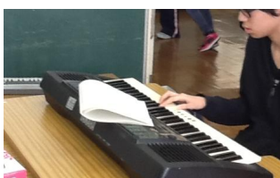
図7 「昼休みの練習風景」