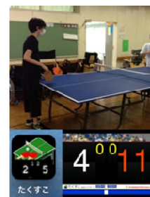
図10 「卓球に取り組む」

これからもiPadを活用することで活動の幅を広げて、様々な体験を積み重ねて充実した高校生活を送ることを期待している。