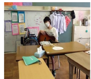
図5「ギターに取り組む」